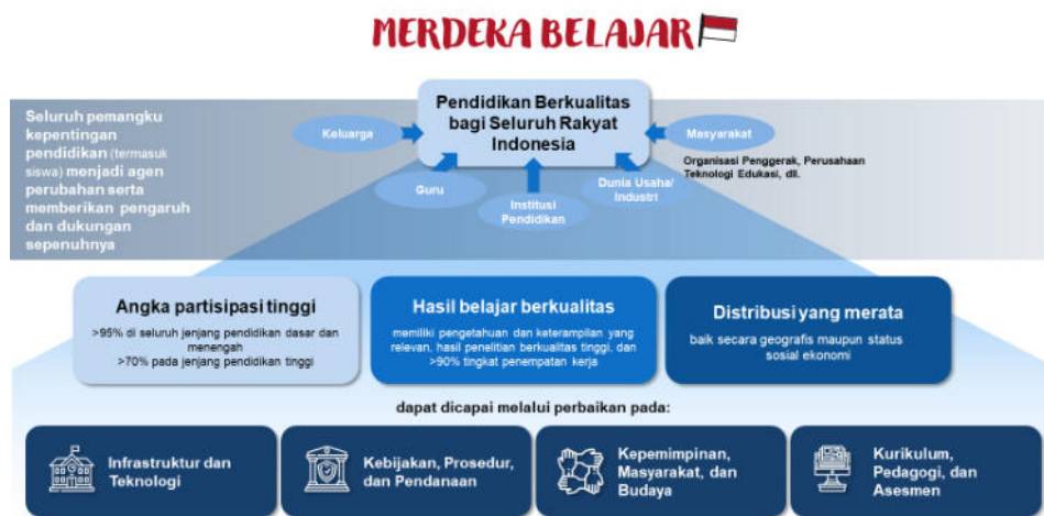
Gambar 1.2 Kebijakan Merdeka Belajar (RENSTRA KEMNDIKBUD: Peta jalan pendidikan Indonesia, 2020)

Arah kebijakan dan strategi pendidikan dan kebudayaan pada kurun waktu 2020-2024 dalam rangka mendukung pencapaian 9 (sembilan) Agenda Prioritas Pembangunan (Nawacita Kedua) dan tujuan Kemendikbud melalui Kebijakan Merdeka Belajar yang bercita-cita menghadirkan pendidikan bermutu tinggi bagi semua rakyat Indonesia, yang dicirikan oleh angka partisipasi yang tinggi diseluruh jenjang pendidikan, hasil pembelajaran berkualitas, dan mutu pendidikan yang merata baik secara geografis maupun status sosial ekonomi. Selain itu, fokus pembangunan pendidikan dan pemajuan kebudayaan diarahkan pada pementapan budaya dan karakter bangsa melalui perbaikan pada kebijakan, prosedur, dan pendanaan pendidikan serta pengembangan kesadaran akan pentingnya pelestarian nilai-nilai luhur budaya bangsa dan penyerapan nilai baru dari kebudayaan global secara positif dan produktif.