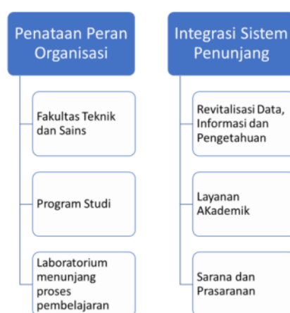
Gambar 3.1 Target pencapaian pengelolaan kelembagaan

Perlu adanya satu sinkronisasi bersama terkait dengan penataan peran organisasi dan penataan sistem infrastruktur. Secara umum, penataan organisasi dilakukan dengan melaksanakan revitalisasi peran individu di tingkat Program Studi, laboratorium di bawah koordinasi Fakultas dengan tujuan menciptakan efisiensi organisasi dan meningkatkan kinerja. Selanjutnya adalah penataan sistem infrastruktur melalui modernisasi dan integrasi data, informasi dan pengetahuan, sarana dan prasarana, dan layanan akademik. FTS menitikberatkan pada percepatan pemenuhan kelengkapan standar laboratorium untuk menunjang proses pembelajaran, infrastruktur, penataan organisasi, dan penguatan atmosfer akademik.